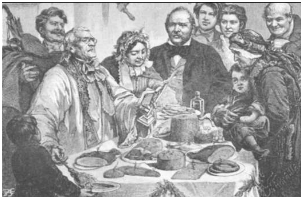
ŚWIĘCONE. Rysunek Andriollego, 1873

kielbasami itp. Spotykając się w święta i ściskając mężczyźni witali się słowami: Resurexit sicut dixit, Alleluja! Dzieląc się jajkiem święconym, starym obyczajem, brano je nie widelcem, ale palcami.”