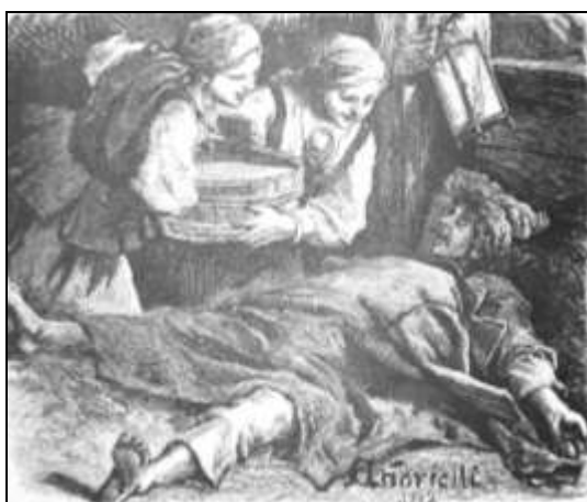
ŚMIGUS. Rysunek Andriollego, 1882.

W dniu drugim śmigus, czyli dyngus rozweselał młodzież, zarówno po dworach, jak zaściankach i chatach wiejskich, z tą tylko różnicą, że gdy w pierwszych opryskiwano znienacka lub za kołnierz pachnącymi wódkami, to u ludu zwykłą miarą był garneczek, lub wiadro wody, a często pod kubłem przy studni, doszczętna kąpiel, przytrzymanej przez parobczaków dziewczki, lub odwrotnie.