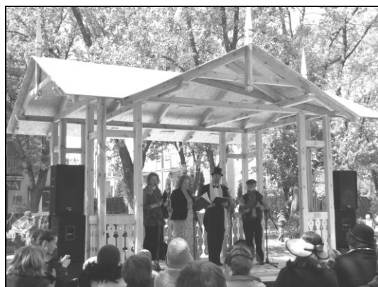
Fot. Robert Lewandowski