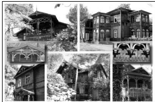
Wawerskie „Zaczarowane domy Andriollego”

Organizator: Klub Kultury Zastów. Współpraca: Biblioteka Publiczna i Zakład Gospodarowania Nieruchomościami w Dzielnicy Wawer m. st. Warszawy oraz Zarząd Transportu Miejskiego. Patronat: Stowarzyszenie Architektów Polskich Oddział Warszawski, Muzeum Elwiro Michała Andriollego w Józefowie.